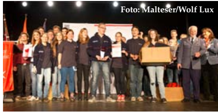
Die Erstplatzierten beim Schulsanitätsdienst-Wettbewerb 2013 aus der Diözese Freiburg