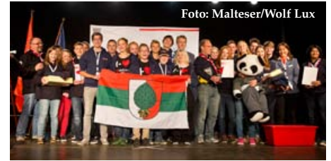
Beim Wettbewerb der Malteser Jugend kam die Gruppe aus Kaufering in der Diözese Augsburg auf den ersten Platz.