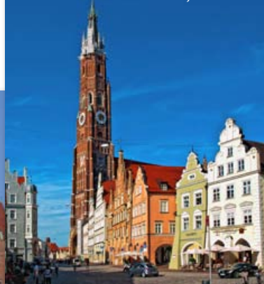
Inmitten des historischen Straßenzugs der „Altstadt“ ragt der Turm der Stadtpfarrkirche St. Martin 130 Meter in die Höhe.