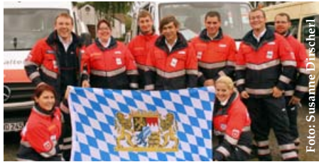
Die Sieger beim Helferwettbewerb kamen aus der Diözese Regensburg – sie sind in diesem Jahr die Ausrichter der Bundeswettbewerbes in „LA“.