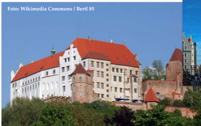
Auf dem Hofberg über der Stadt thronend, erinnert Burg Trausnitz an den Glanz der einstigen Wittelsbacher Residenz. Besonders sehenswert: die Kunst- und Wunderkammer.